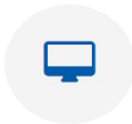
Το e-game του "NEETs on Board"

☞ www.neetsonboard.gr/application-search-job