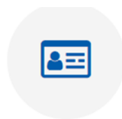
Εφαρμογή αναζήτησης εργασίας

Μάθε για το Πρόγραμμα «Εγγύηση για τη Νεολαία», τη Γαλάζια Ανάπτυξη και την Κοινωνική Οικονομία με έναν πιο διασκεδαστικό τρόπο.